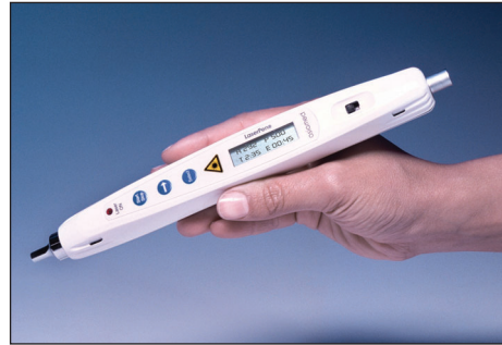
Abb. 1: Modernes Akupunktur-Lasergerät

Fließt die Energie in diesen Bahnen im Gleichgewicht, so ist der Organismus gesund. Ein Ungleichgewicht