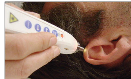
Abb. 2: Laserakupunktur am Ohr