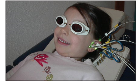
Abb. 3: Eine gleichzeitige Stimulation verschiedener Akupunkturpunkte ist bei einigen Lasergeräten mit mehreren Lichtleiterausgängen sowohl am Ohr wie auch an unterschiedlichen Körperstellen möglich.

Behandelt werden kann jeder Patient, der diese Alternative zur Akupunkturnadel wünscht, bei Kindern und Säuglingen versteht sich natürlich der Einsatz des schmerzfreien Lasers von selbst. Die Laseranwendung kann auch sehr gut mit der Nadelbehandlung zur Wirkungsverstärkung kombiniert werden.